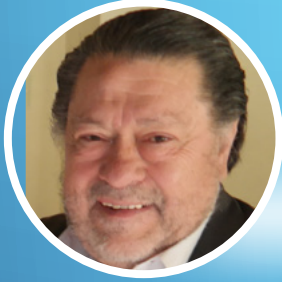
08 | Salvador Maiz Integradores BTS