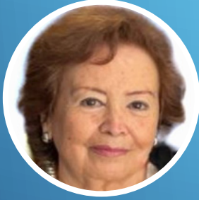
14 | Margarita Trelles Transoceánicas Viajes