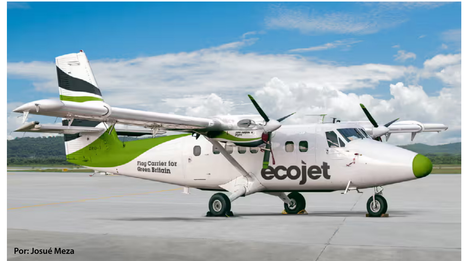
Por: Josué Meza

E cojet es el nombre de la aerolínea británica que será la primera en operar una aeronave eléctrica a partir del 2025. Su flota estará compuesta por aviones convencionales de turbo hélice con capacidad de 19 a 70 asientos, pero equipados con motores eléctricos de hidrógeno. Es decir, sus aviones pasarán a lo eléctrico, pero operarán