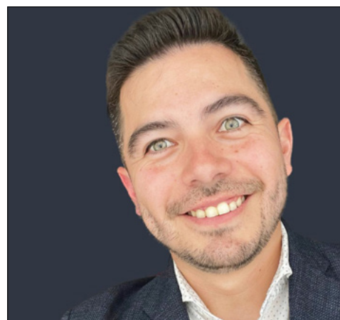
■ Por Andrés Mejía

comunidad LGBTQ+. Por tanto, resulta sumamente relevante adquirir capacitaciones especializadas si se tiene la intención de dirigirse a este mercado.